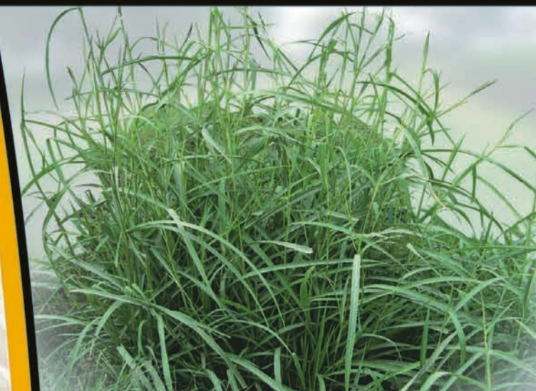
Caminadora ( Rottboellia spp.).