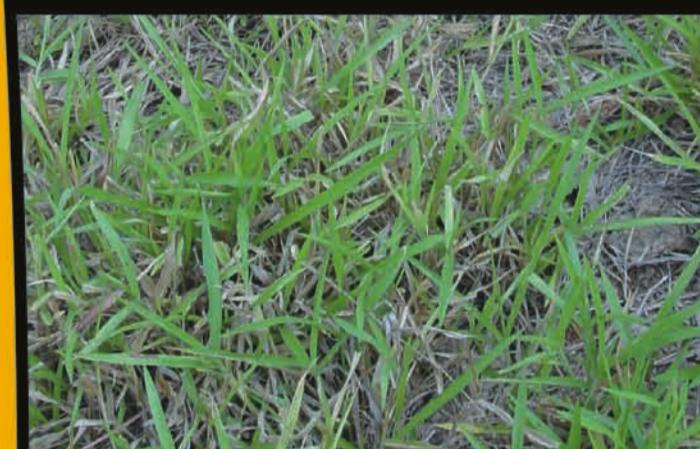
Pastos del género Brachiaria .