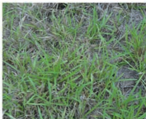
Pastos del género Brachiaria .

Evite la diseminación de la plaga. No lleve suelo de una zona infestada por el salivazo hacia una zona libre del insecto. Limpie siempre el barro de las botas antes de salir del campo.