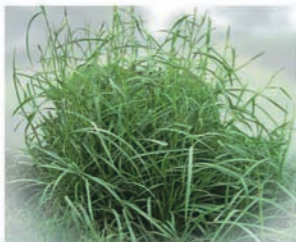
Caminadora ( Rottboellia spp.)